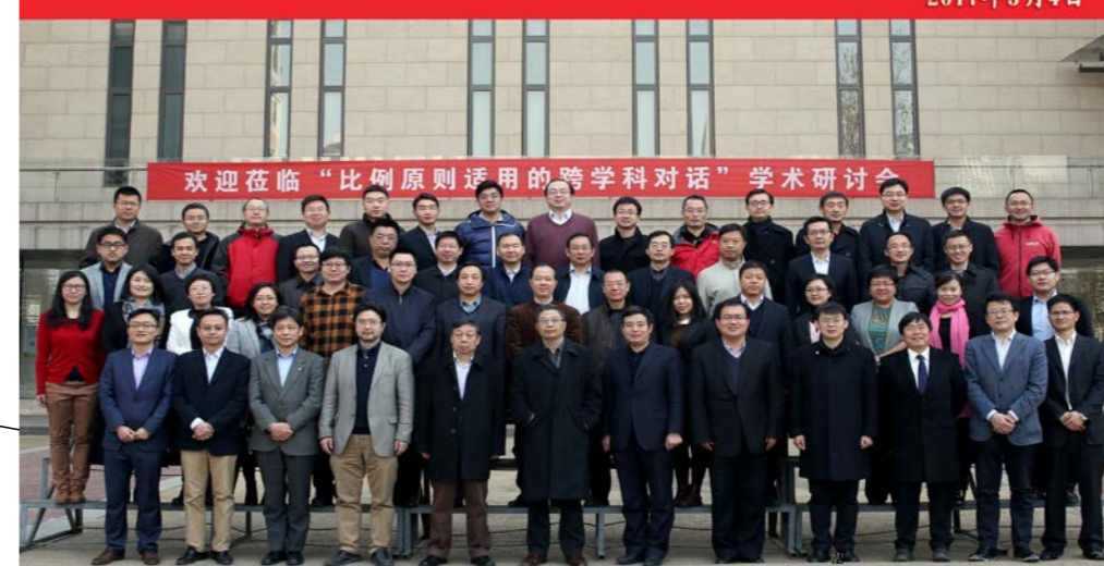
“比例原则适用的跨学科对话”学术研讨会合影留念 2017年3月4日